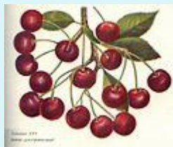
Вишня ультраплодна я