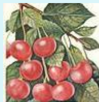
Вишня Краса севера