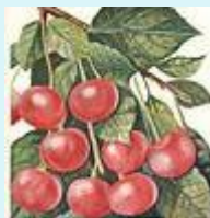
Вишня Краса севера