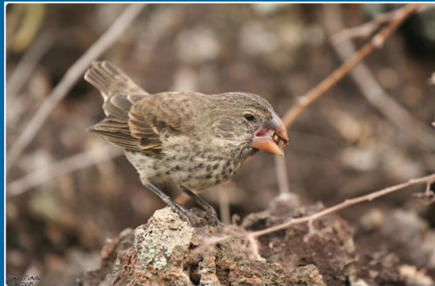
Земляной вьюрок Galapagos Journey.