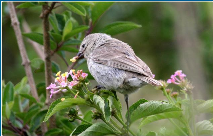
Большой кактусовый вьюрок Galapagos Journey.