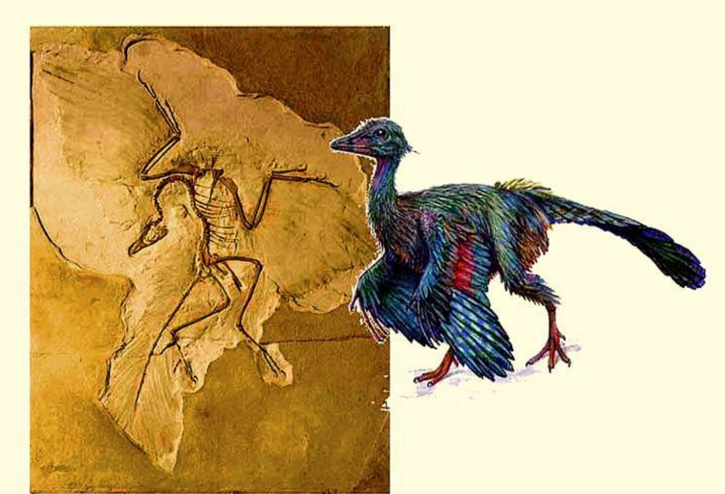
Археоптерикс- древняя вымершая птица, предок современных ПТИЦ