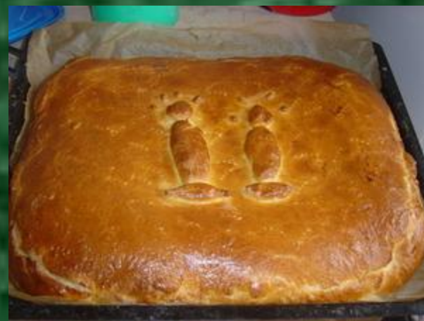
Рис едят отварным, из него варят каши и делают запеканки, рис добавляют в супы, салаты, используют как начинку для пирогов, готовят из риса плов с овощами и бараниной.