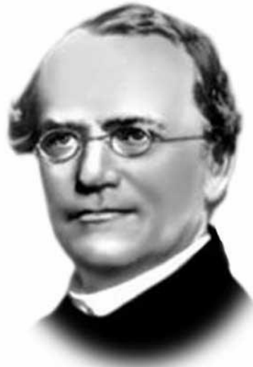
МЕНДЕЛЬ Грегор Иоганн 1822-1884