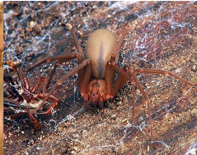
Коричневый паук отшельник