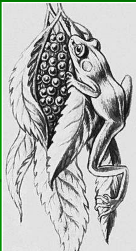
Гнездо южноамериканской филломедузы.