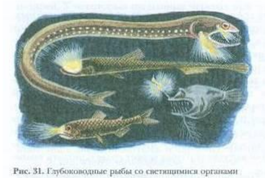
Рис. 31. Глубоководные рыбы со светящимися органами.