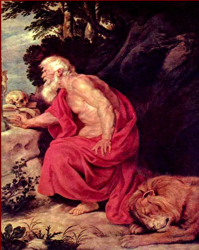
Петер Пауль Рубенс «Святой Иероним»