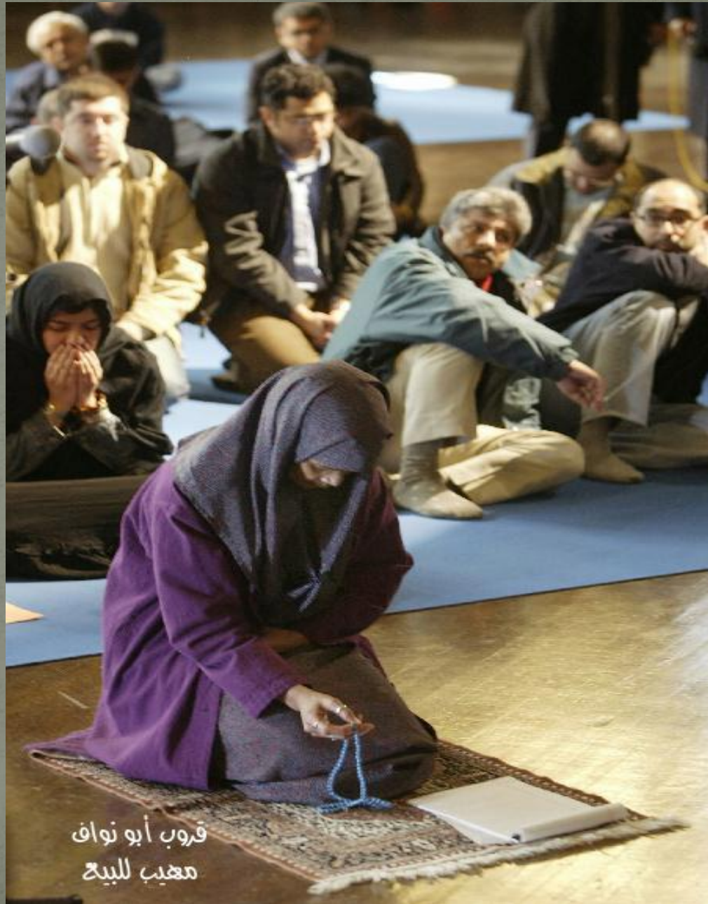
قروب أبو نواف معيب للبيح