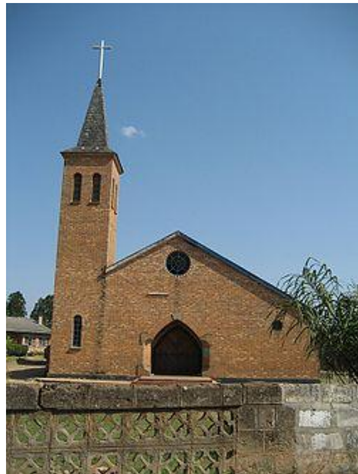
Католическая церковь в Манса.

На Вечере Господней в 2011 г. присутствовало 758 811 человек (5,6 % населения).