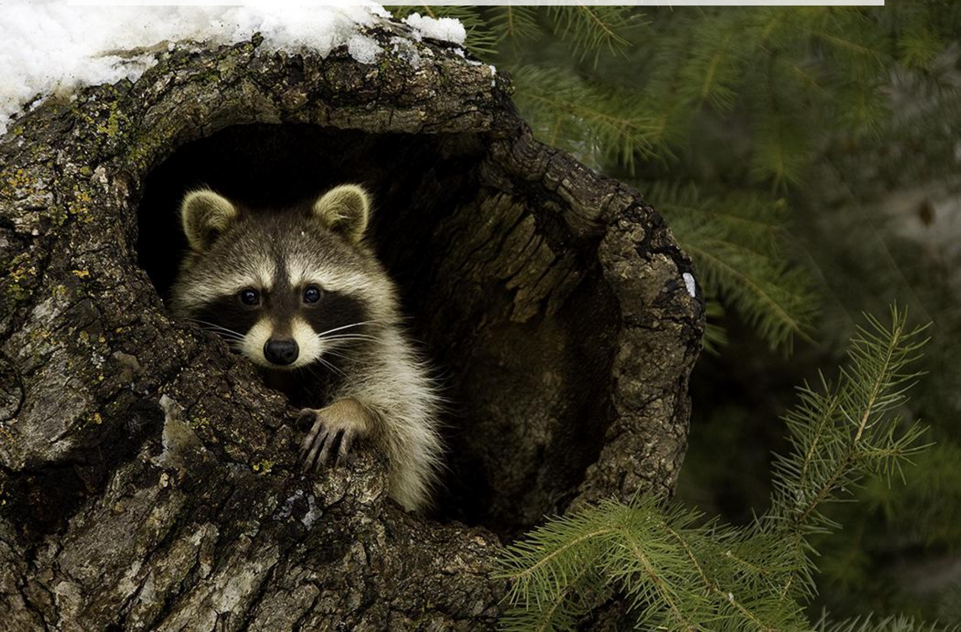
ЕНОТ – ПОЛОСКУН