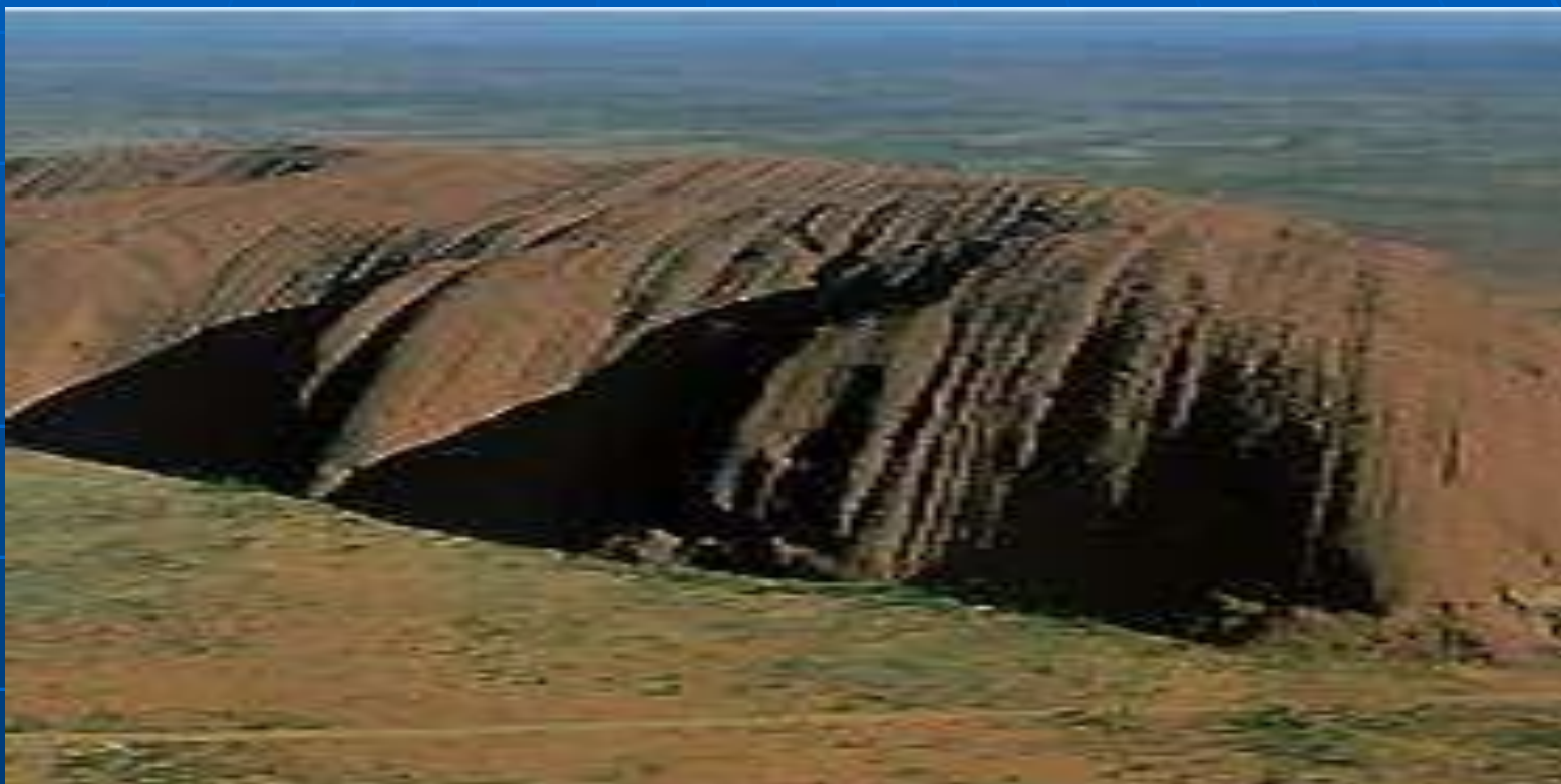
Скала Эйса (Центральная Австралия).