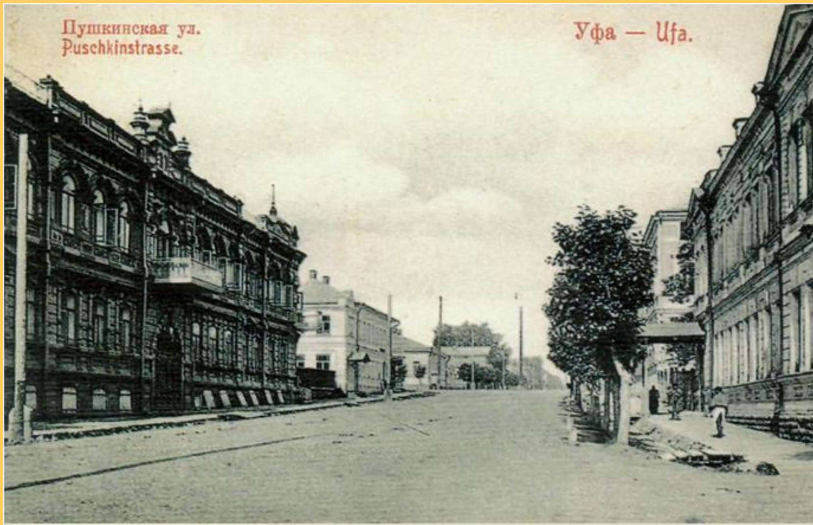
Ул. Пушкинская (Пушкина)