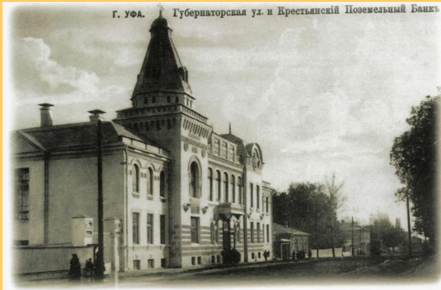
Ул. Губернаторская (Советская)