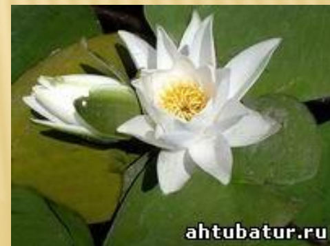
Чилим или водный орех