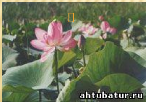
Лотос-реликтовый цветок фараонов

Причины: Рост численности населения, освоение новых земель, нерегулируемый выпас скота и эксплуатация богатств прир.