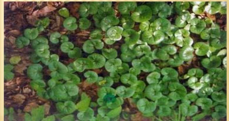
Копытень европейский – третичный реликт