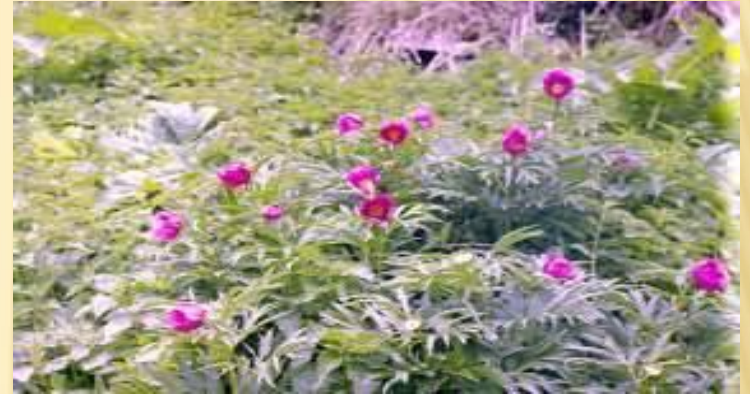
Пион – редкий исчезающий вид