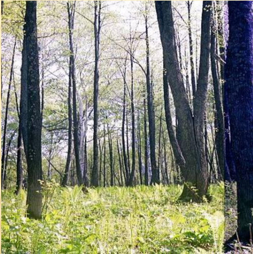
Кузедеевский липовый остров – остаток теплолюбивых широколиственных лесов третичного периода