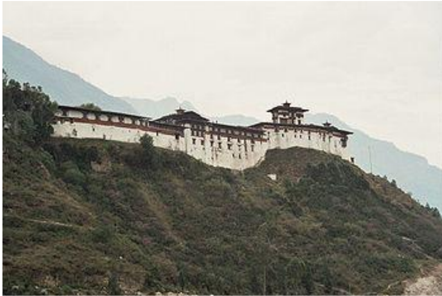
Дзонг Вангди-Пходранг в Бутане.

Дзонги сочетают массивные стены, башни, вереницу внутренних дворов, храмы, административные здания, жильё для монахов. Обычно дзонги расположены в горах, защищённые скалами.