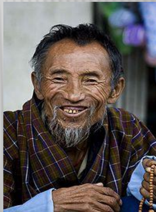
Типичный представитель коренного населения Бутана

Мужчины носят гхо, или тяжёлый халат длиной до колен, который подпоясывают поясом. Женщины носят красочные блузки, поверх которых надевают большой прямоугольный кусок ткани, называемый кира. Поверх кира может носиться короткий шелковый жакет, или тего. Повседневные гхо и кира делаются из хлопка или шерсти, в зависимости от времени года, и украшаются простыми узорами в виде полос и клеток.