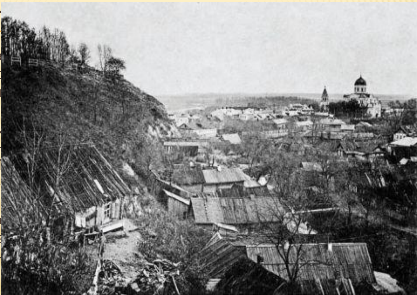
Первая фотография Брянска. 1871 год

Впервые 1146 год слова Д дьбрь/д поросш состав Ч Речью Г Киевско губерни Брянско обществ механич губерни области.