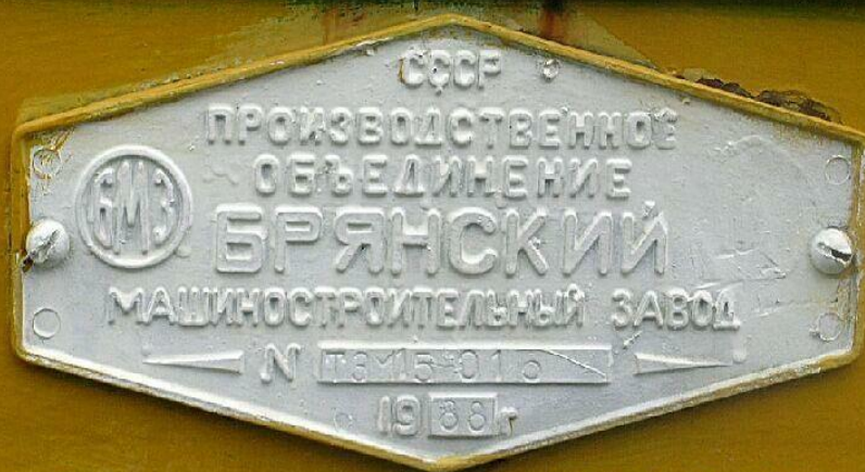
Табличка на тепловозе ТЭМ15 в музее на ст.Сеятель