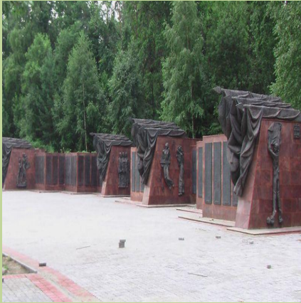
Памятник воинам водителям