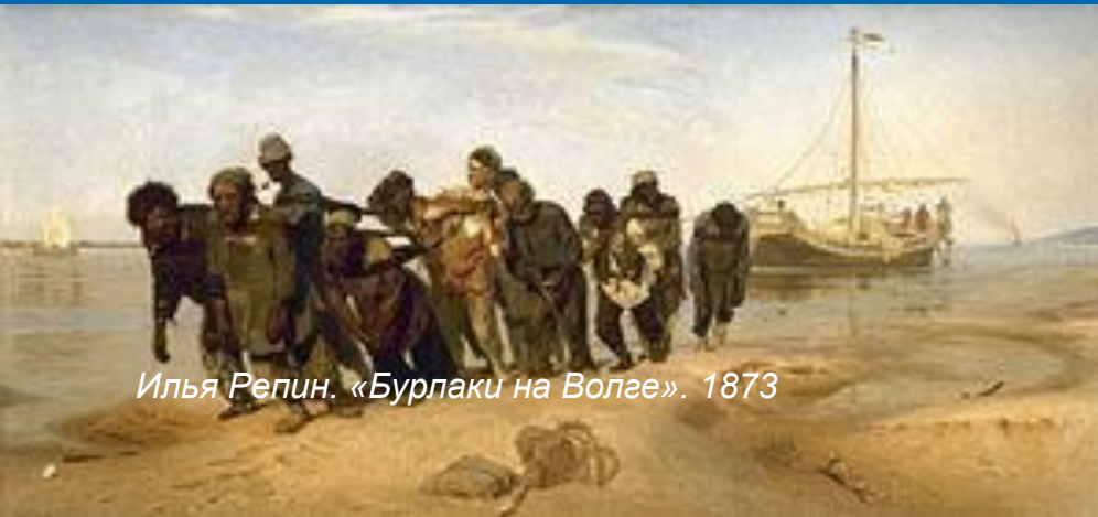
Илья Репин. «Бурлаки на Волге». 1873

Она всегда одушевлена, ей приписываются человеческие качества, а идеальный русский человек должен соответствовать образу этой реки.