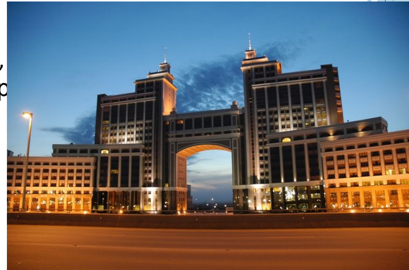
Здание национальной нефтяной компании КазМунайГаз