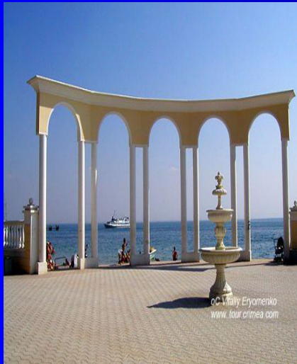
Скала святого Явления