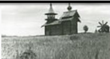
Часовня Михаила Архангела.