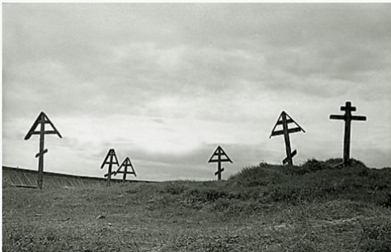
Остатки старообрядческого кладбища в пределах ограды

Деревянная ограда до наших времён не дошла, но была воссоздана в 1959 году по образцу других оград ПОГОСТОВ.