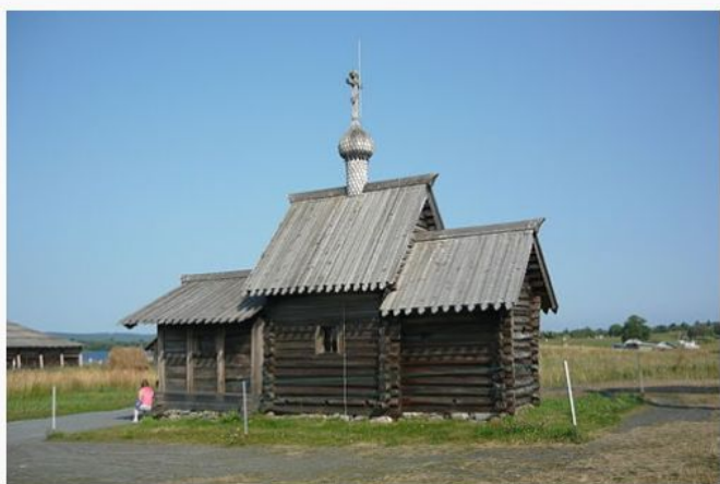
Церковь Воскрешения Лазаря —

Также на острове есть и другие достопримечательности: Церковь Воскрешения Лазаря, Часовня Михаила Архангела, Восьмикрылая ветряная мельница и прочие.