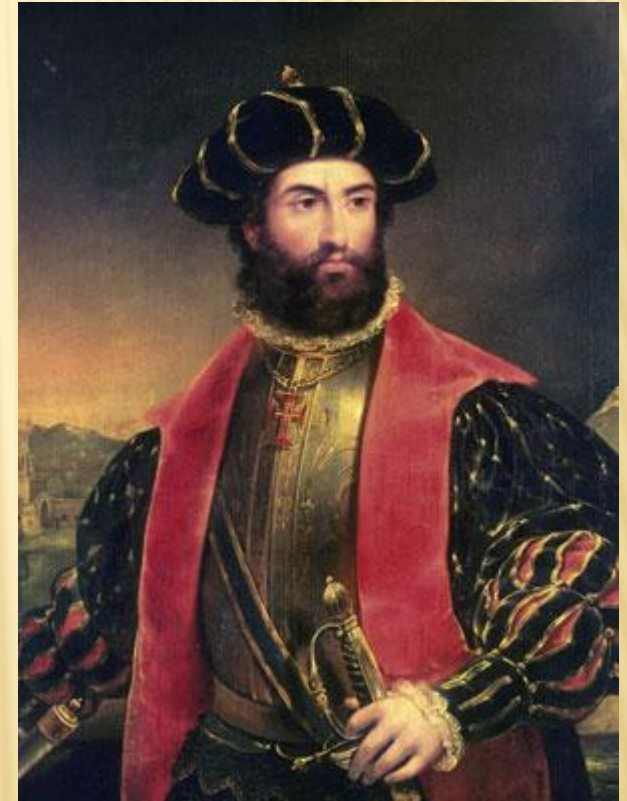
Васко да Гама