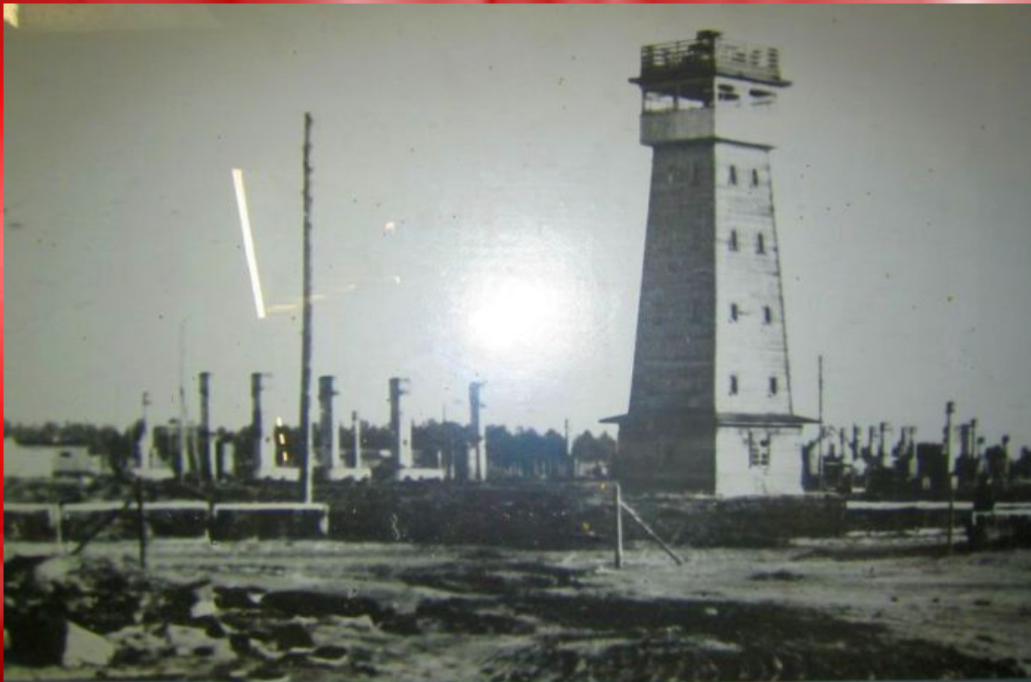
Фотія, зроблена в'язем'ю неметне 1944. р. рудені Фотіастамі Сабаспільскіі лагерь смерті, осень 1944 г.