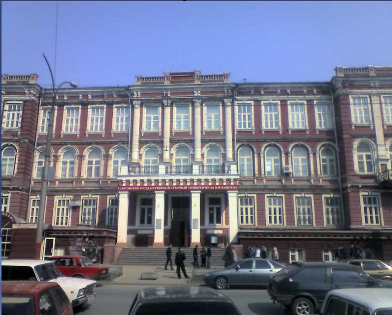
Саратовский государственный аграрный университет им. Н.И. Вавилова