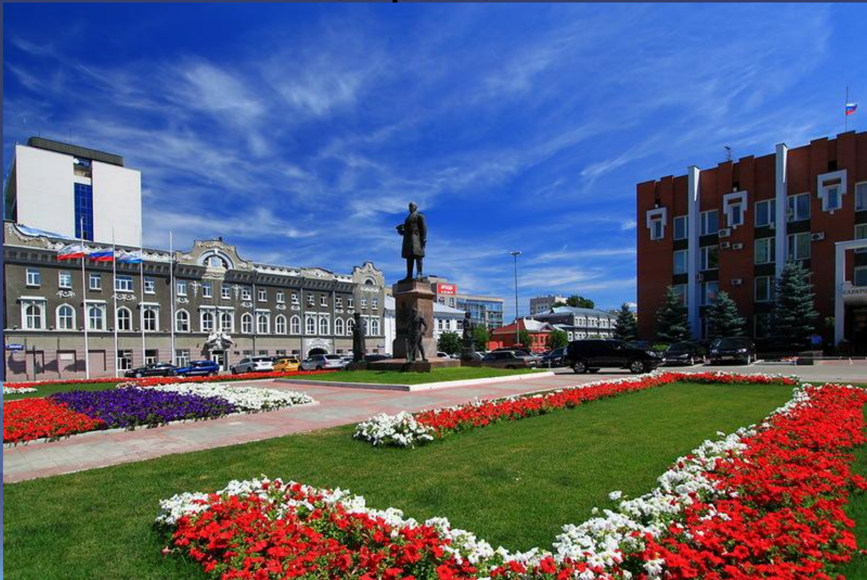
Площадь Столыпина, слева Мэрия