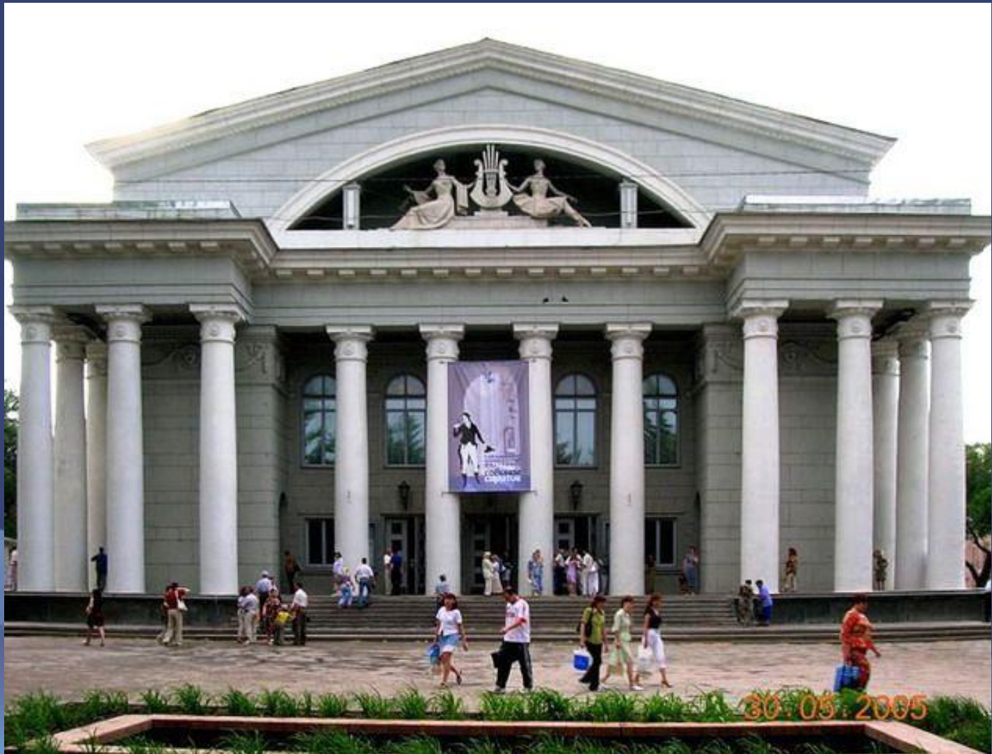
Театр оперы и балета