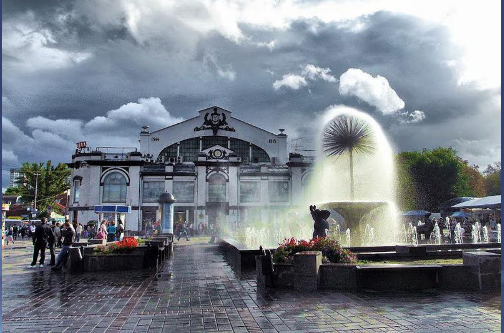
Рынок, рыночная площадь