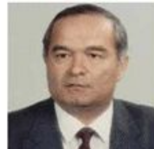
Каримов Ислам Абдуганиевич