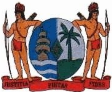
HET WAPEN VAN SURINAME