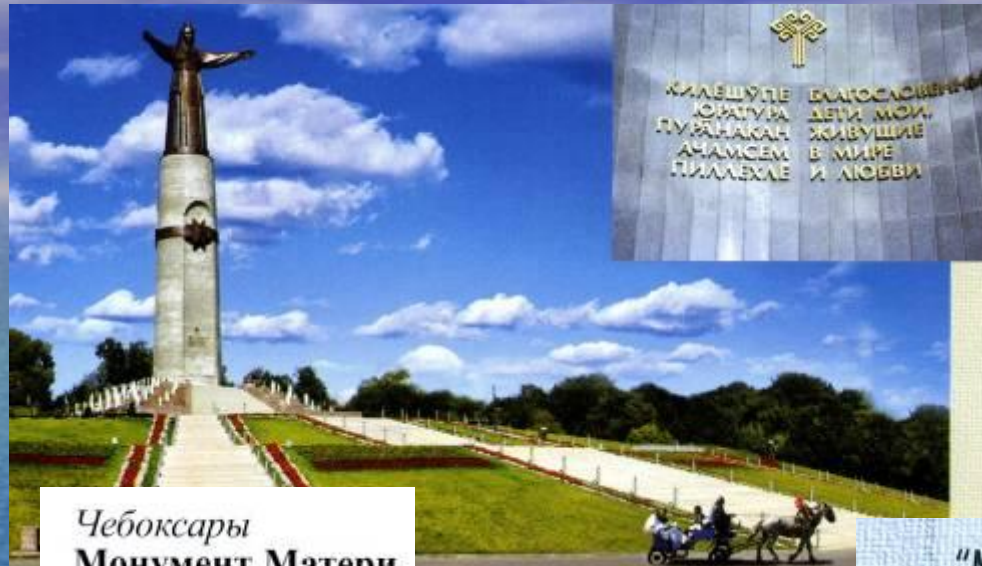
Чебоксары Монумент Матери.