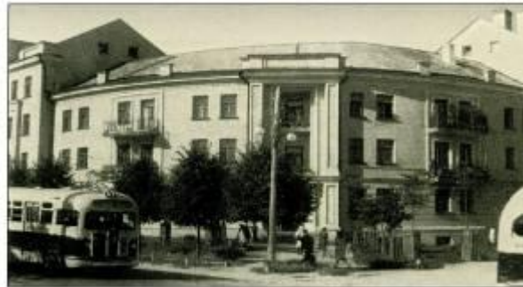
Перекресток улиц К. Маркса и Володарского, 1960-е годы.