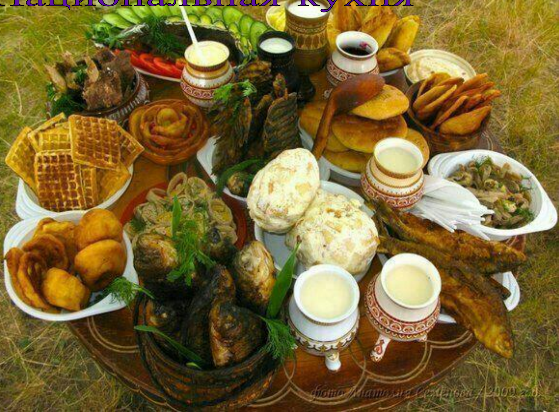
фото Анастасия Седякина / 2009 год