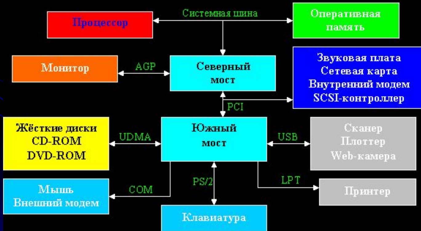
Логическая схема системной платы