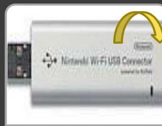
Nintendo Wi-Fi USB Connector