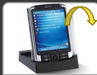
КПК Acer n300