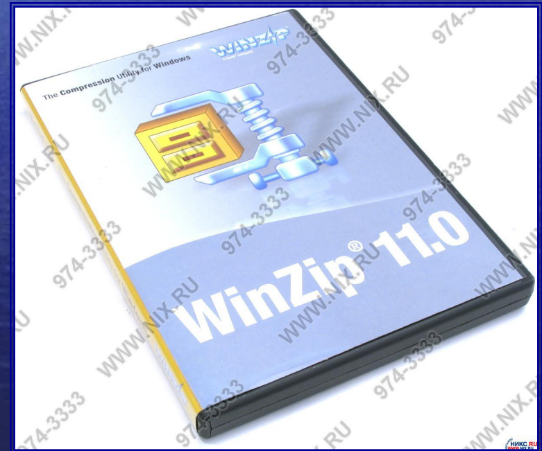
Диск с архиватором

Многие архиваторы используют сжатие без потерь для уменьшения размера архива.