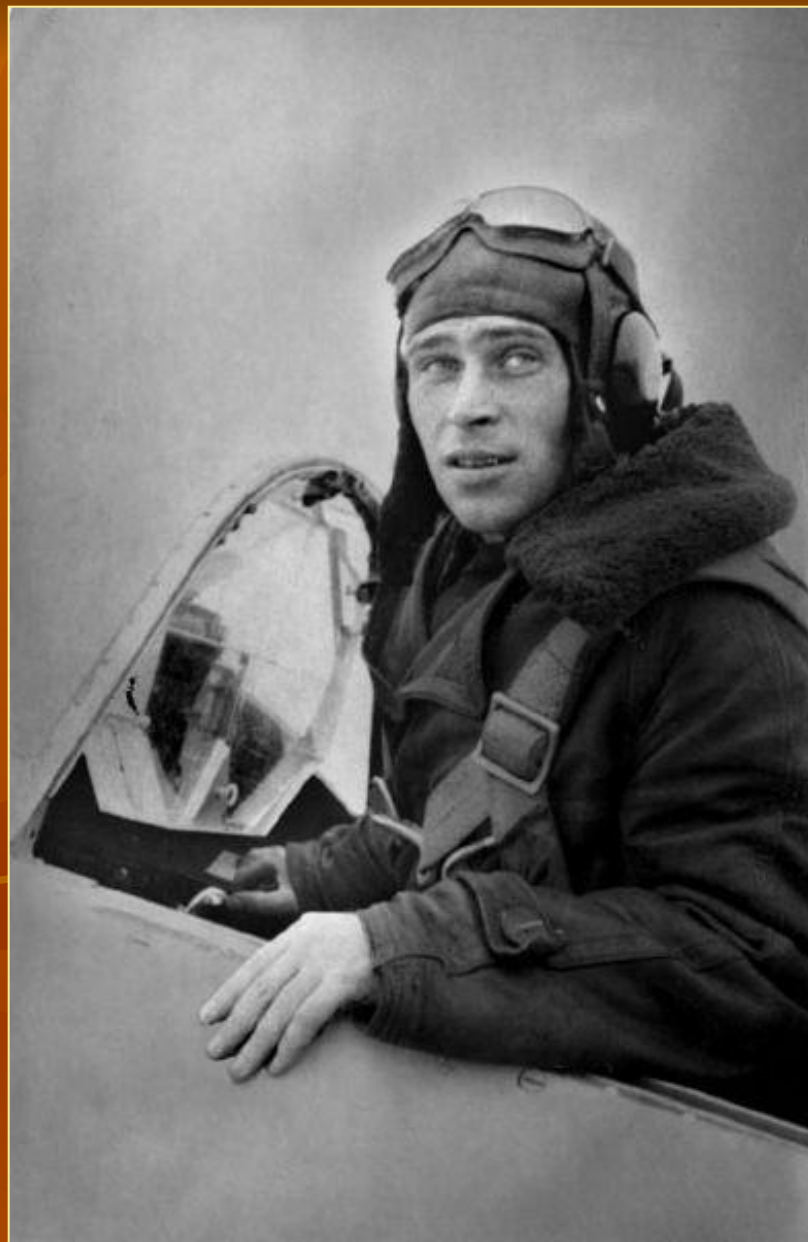
■ Лётчик Виктор Талалихин