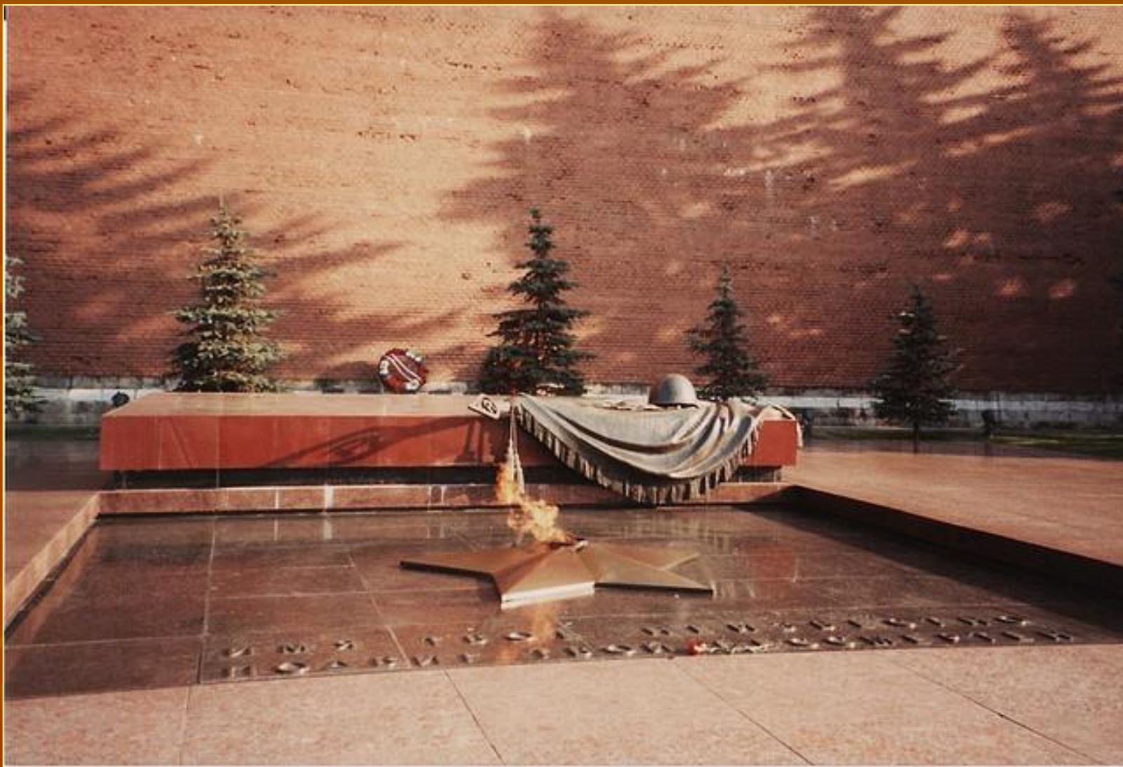
Красная площадь. Вечный огонь