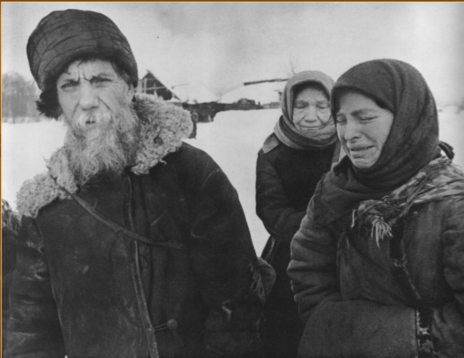
■ Беженцы под Истрой