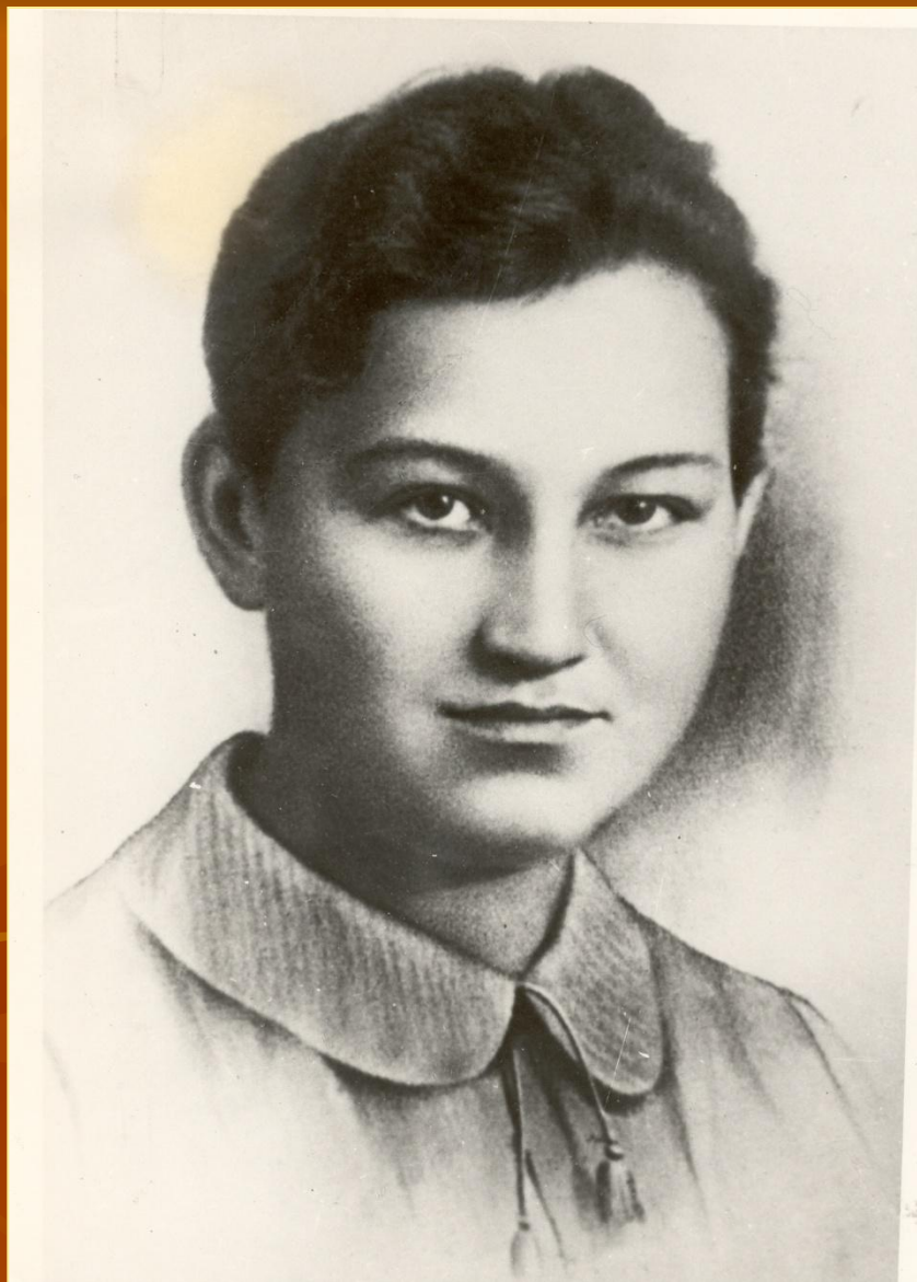
■ Зоя Космодемьянская