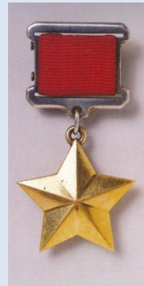
Герой Советского Союза Аскин Г.Г.