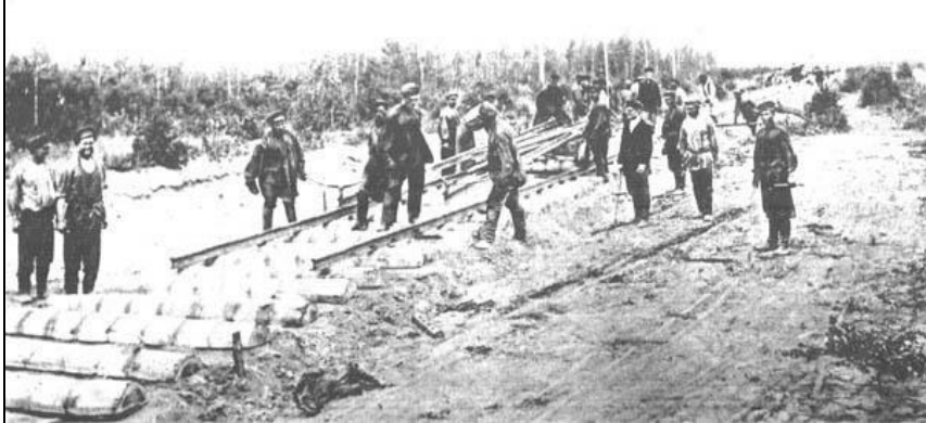
Великий Сибирский путь. — Grand Chemin de la Sibérie. № 45. Укладка пути.