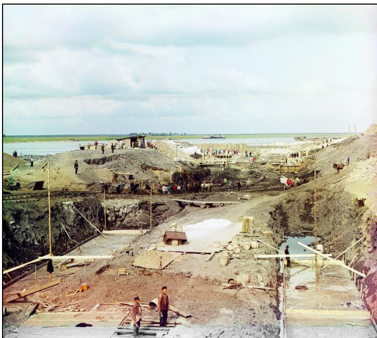
Работа по постройке Кузьминского шлюза. 1912 г.