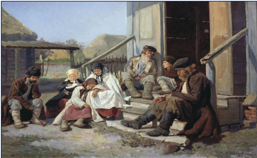
Крестьянская семья на отдыхе. Начало XX века.

5. В начале XX в. Россия- первая в мире по объему сельхозпродукции. На долю России приходилось 50% мирового сбора ржи, 20% пшеницы, 25% экспорта зерна. Несмотря на это С/Х развивалось самотеком. Поля обрабатывались вручную сохой и бороной, не было удобрений, урожайность низкая. В деревне часто голод. Тормозило развитие С/Х сохранение общины и помещичьих хозяйств. На 20 млн. крестьянских хозяйств приходилось 130 тыс. помещичьих. У общины было 4/5 всей крестьянской земли. Также проблемой были «лишние рты» в деревне. Земли всем не хватало, а продуманной переселенческой политикой государство не занималось.