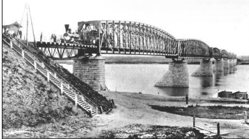
р. Обь, 1897, 820 м