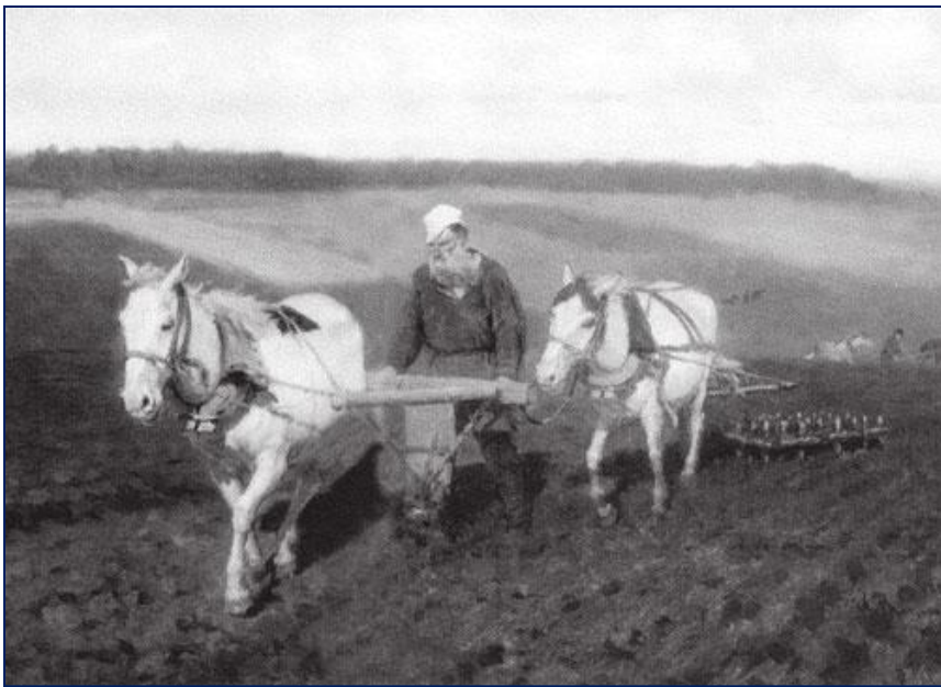
Обработка земли. Начало XX века.