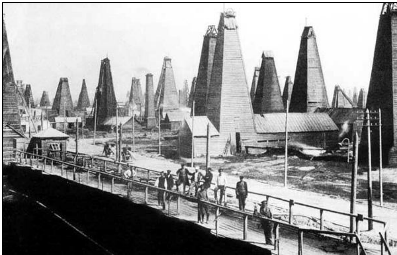
Корпуса монополии «Нобель- Мазут» в Баку.

4. На волне мирового экономического кризиса 1900-1903 гг. в России пострадали предприятия тяжелой промышленности, погибли слабые, малые предприятия, отстающие в финансовом и техническом оснащении. Закрылось свыше 3 тыс. предприятий , на которых работало 112 тыс. рабочих . Ответом капитализма стало создание монополий . Крупнейшими были «ПРОДАМЕТА» (1901), «Продуголь», «Продвагон», «Гвоздь», объединивших под своим началом десятки крупных предприятий.