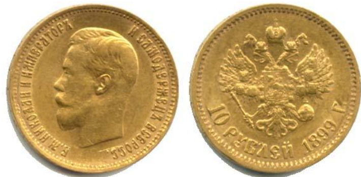
«Николаевский» золотой рубль- имперал.

ДИРЕКТОРЫ: ГЕНЕРАЛЬ-ДИРЕКТОРЪ БРАТРЕВЪ НОБЕЛЬ М. О. Османъ Н. Келлерманъ С.-Петербургъ, 1904, St.-Petersburg