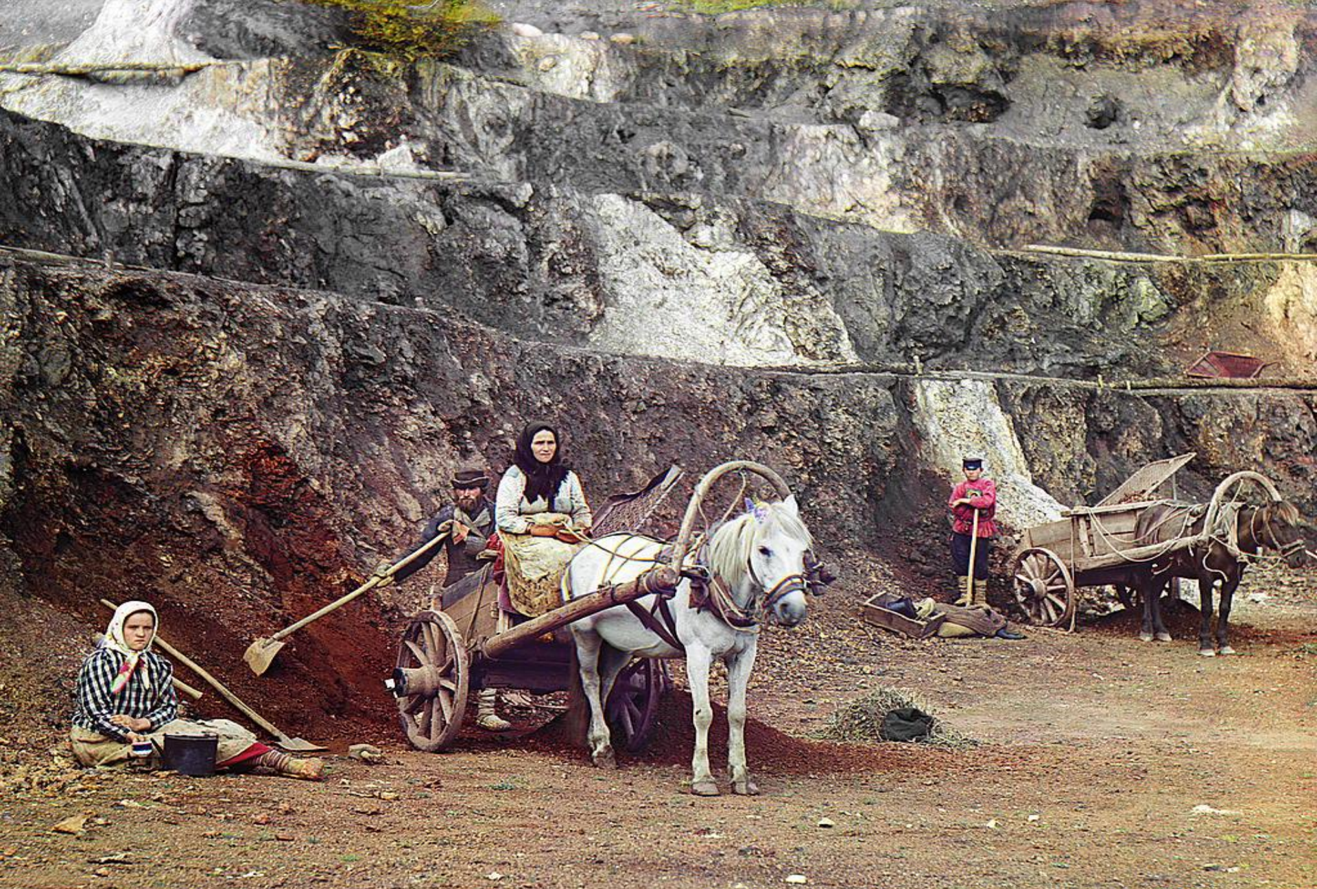
Работа на Бакальском руднике. 1910 г.