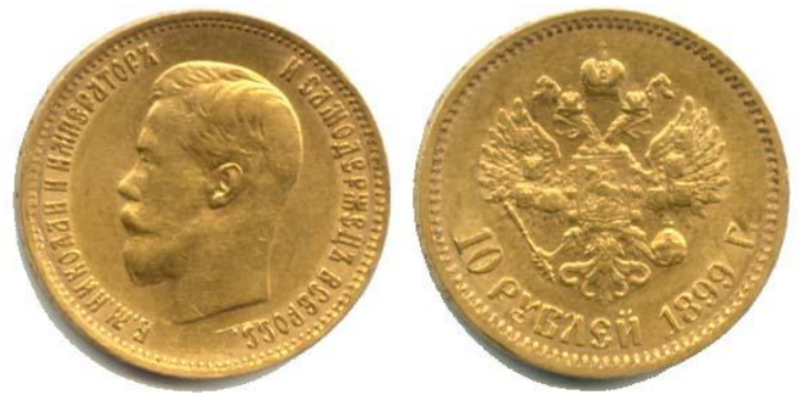
«Николаевский» золотой рубль- имперал.

ДИРЕКТОРА ДИРЕКТОРА БРАТЯ НОБЕЛЬ М. О. Османъ Н. Вилъсонъ Кассиръ Кассиръ С.-Петербургъ, 1904, St.-Petersburg