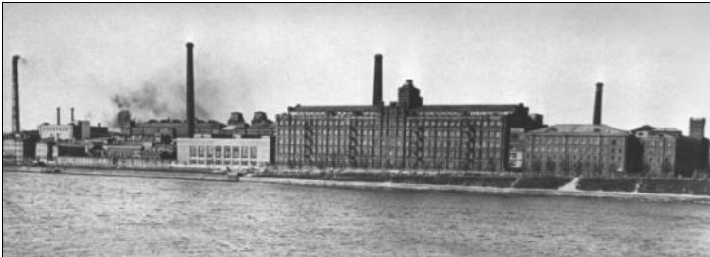
Комплекс построек товарищества Невской бумагопрядильной мануфактуры.