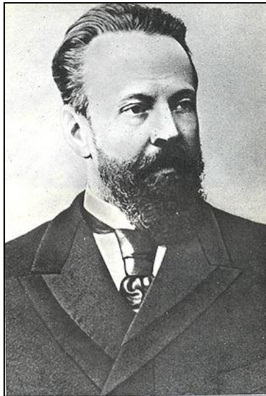
С.Витте. Министр финансов империи в 1892—1903 гг.

Отставание аграрного сектора, со- хранение феодалных пережитков