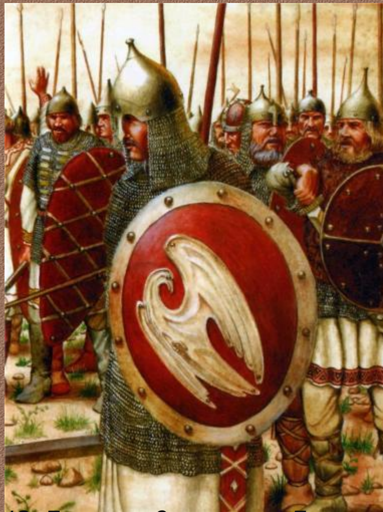
Ю. Лазарев. Завоевание Болгарского царства. 968—969 годы