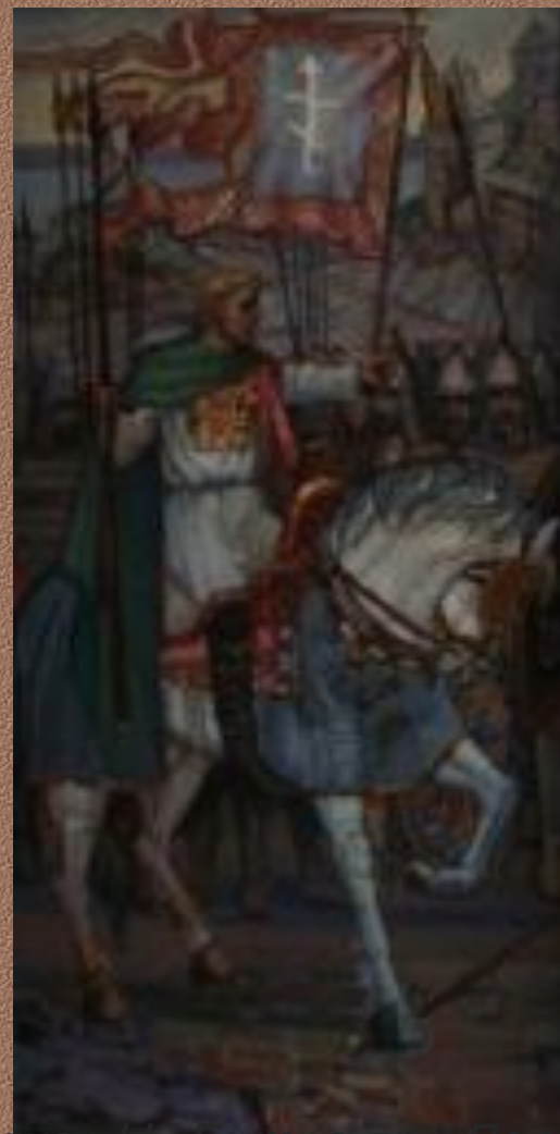
Боляков Н. Битва при Доростол (триптих). Цимисхий

Византийцы имели численное и техническое превосходство, но не смогли разбить противника и взять Доростол. Силы Святослава были на исходе, поэтому почетный мир вполне его устраивал.