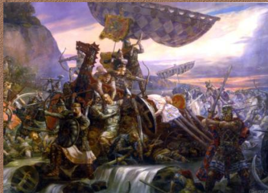
Клименко. Последняя битва Святослава

Печенеги во главе с князем Курей внезапно напали на Святослава у днепровских порогов.