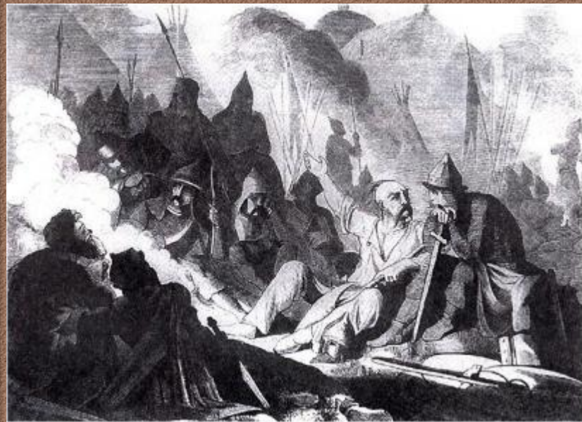
Б. А. Чориков. Военный совет Святослава.

С тяжелыми боями, отбиваясь от наседающего врага, отходили русские к Дунаю. Там, в городе Доростоле, последней русской крепости в Болгарии, отрезанное от родной земли, войско Святослава оказалось в осаде.