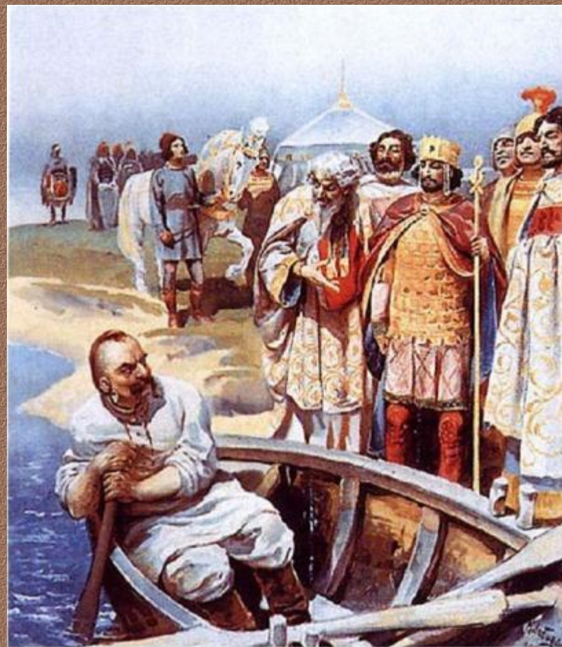
К. Лебедев. Встреча Святослава с Иоанном Цимисхием

После заключения мира состоялось свидание Святослава с Цимисхием.