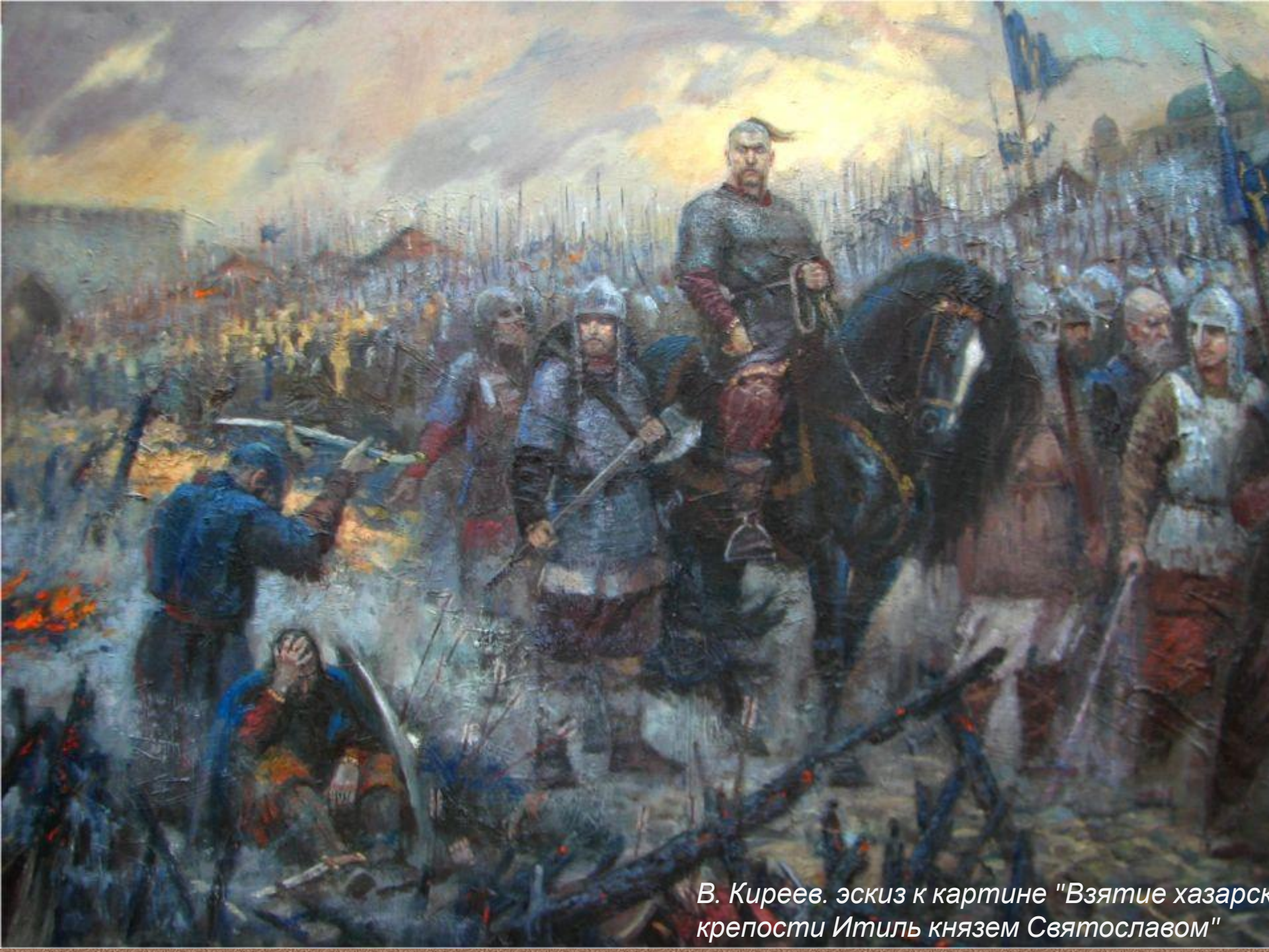
В. Киреев. эскиз к картине "Взятие хазарской крепости Итиль князем Святославом"