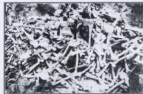
Фото 14 – ОСТРОВКИ (OSTROWKI) и ВОЛА ОСТРОВИЦКА (WOLA OSTROWIECKA), уезд Люблин, повстанчество 1942-1943

Результат проведенной 17 – 22 августа 1942 года массовой расчистки полянков, расположенных в районе Островки и Воля Островицка, совершённой террористами ОУН – УПА (OUN – UPA). Украинские источники из Киева с 1944 года сообщают об общей количестве жертв в двух перечисленных селах 2 000 человек.