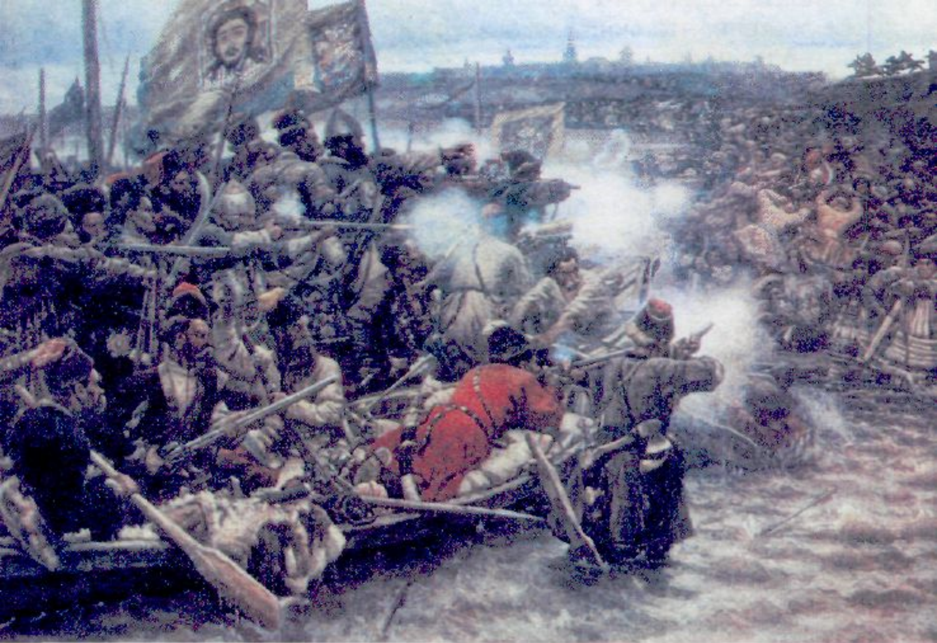
«Покорение Сибири Ермаком». Картина В. Сурикова. Художник воспроизвел знаменитое сражение у Чурашьева мыса