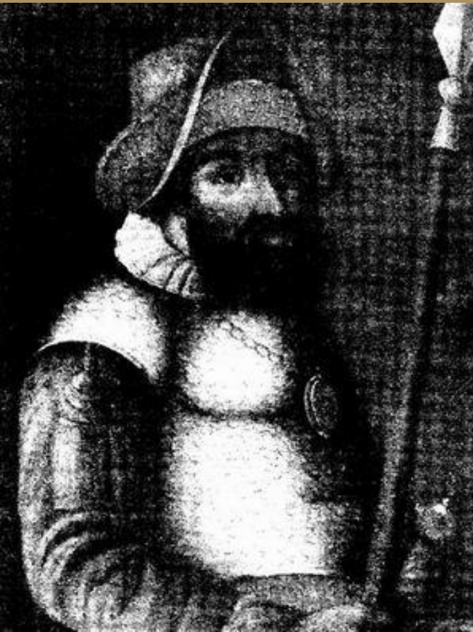
Портрет Ермака Тимофеевича