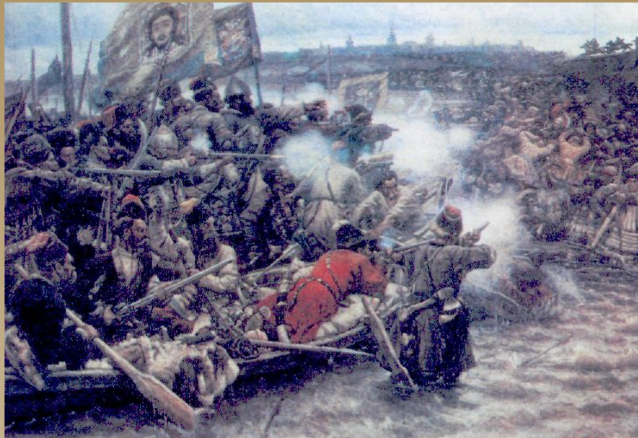
«Покорение Сибири Ермаком». Картина В. Сурикова. Художник воспроизвел знаменитое сражение у Чувашева мыса