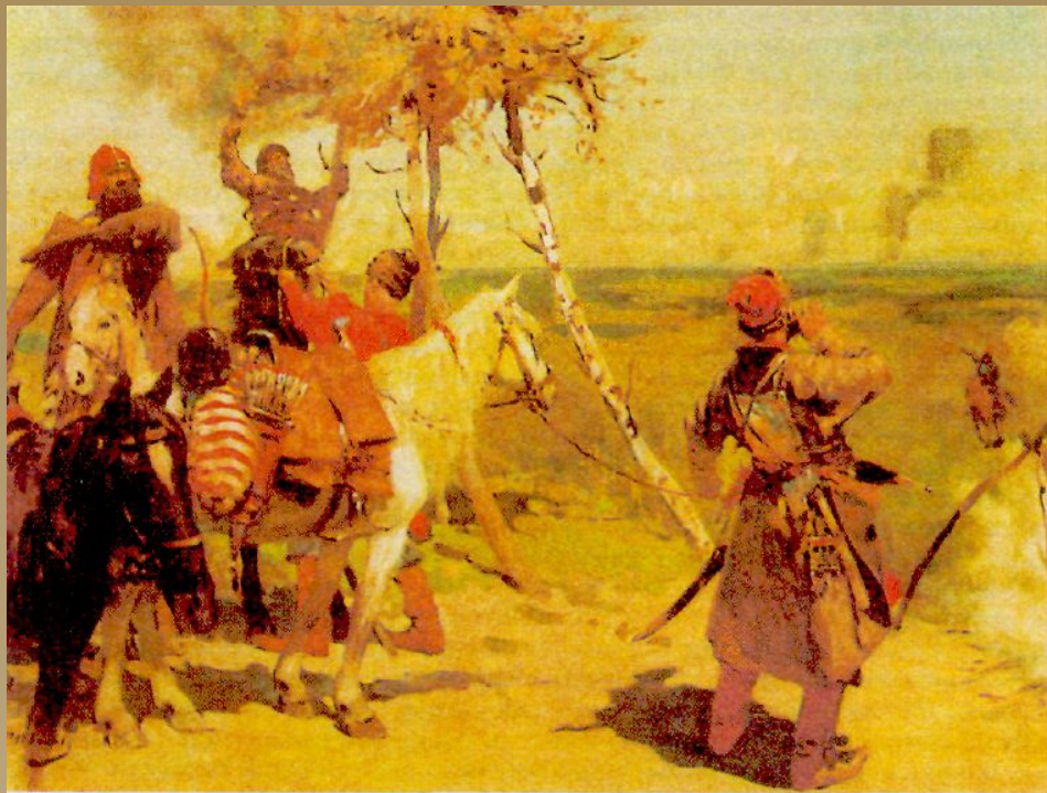
«На сторожевой границе Московского государства». Картина С. Иванова

1581 г. выдался крайне неблагоприятным для Русского государства: