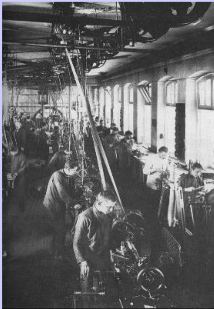
В цехе завода Г.Пека в Петербурге.

Быстрыми темпами развивалась текстильная промышленность. Владельцы мануфактур покупали земли в Ср. Азии и начали выращивать там хлопок. За 30 лет производство текстиля выросло в 30 раз. На Юге успехов достигла свеклосахарная промышленность (рост в 6 раз).