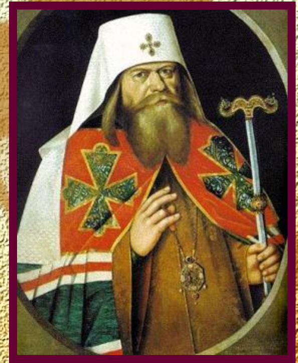
Патриарх Андриан (копия парсуны XVII века)