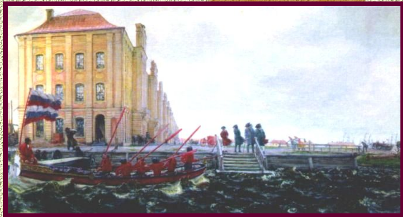
Здание 12 коллегий