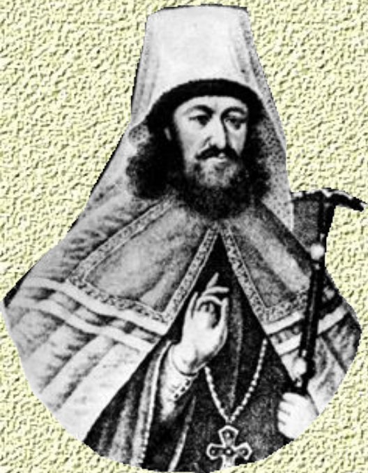
Стефан Яворский – местоблюститель с 1700 г.

Создание Святейшего Синода, контролируемого обер-прокурором, как «ока государева и стряпчего о делах государственных в Синоде»