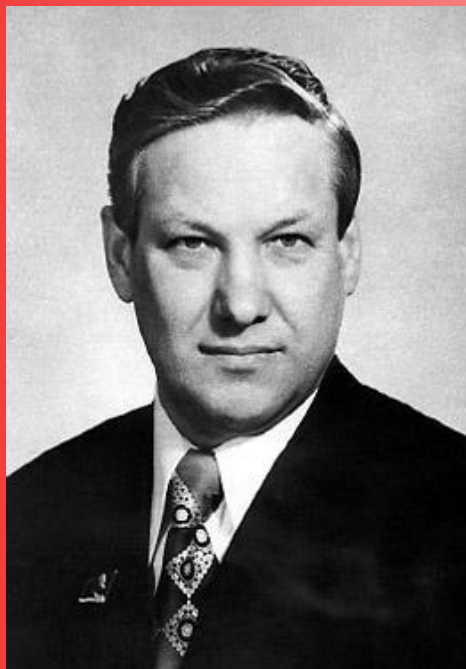
Б.Н. Ельцин (фотография 1970-х годов)

Б.Н. Ельцин родился 1-го февраля 1931 года в трудовой семье. Получил высшее строительное образование, работал на руководящих постах. В 1976 году занял должность первого секретаря Свердловского обкома, а затем стал членом ЦК КПСС. В октябре 1987 года был снят со всех постов из-за своих демократических убеждений. Спустя два года Ельцин был избран народным депутатом СССР и членом Верховного Совета. 12-го июня 1991 года состоялись выборы Президента РСФСР. Главой государства стал Б.Н. Ельцин.