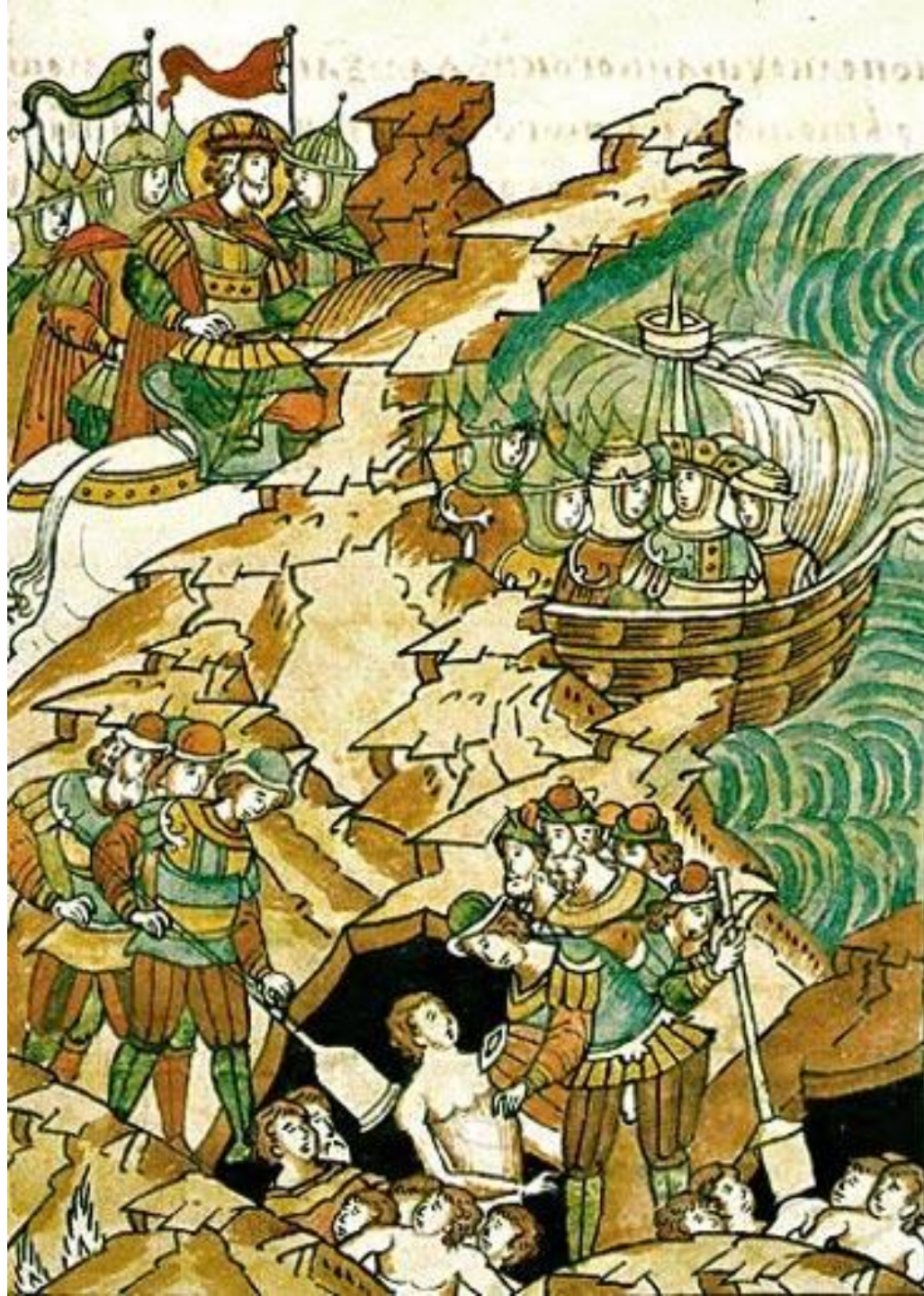
Невская битва. Миниатюра из Лицевого Жития Александра Невского