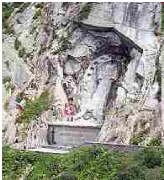
Памятник Суворову в швейцарских Альпах