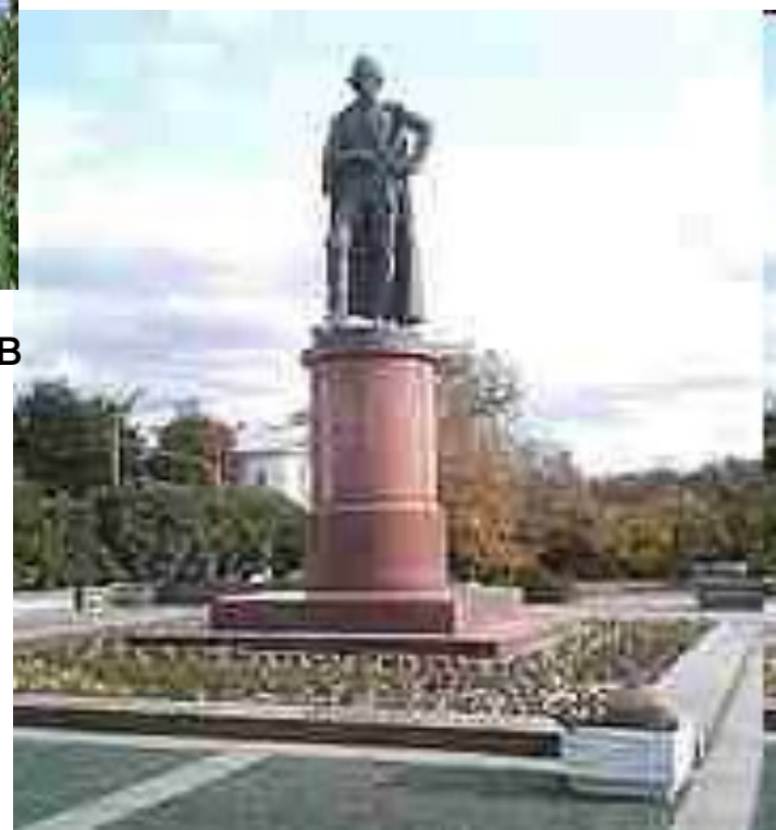
Памятник Суворову в Москве. Скульптор О. К. Комов