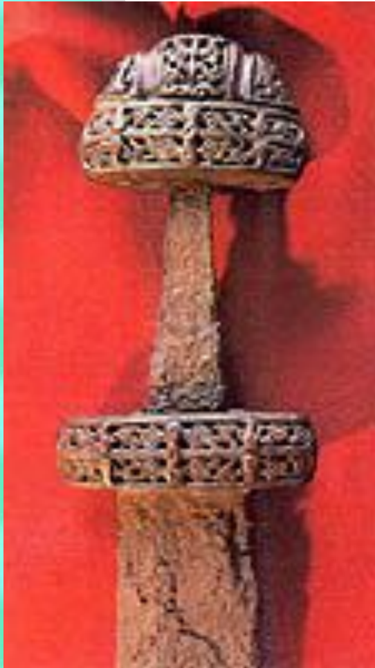
Боевой меч 8 века