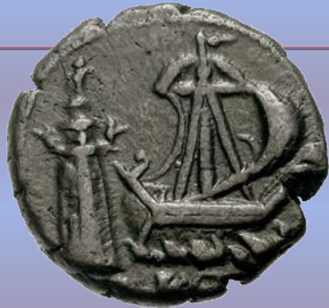
Изображение Александрийского маяка на монетах.