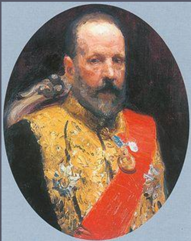
С.Ю.Витте. Министр финансов с 1892г.