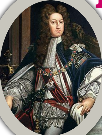
Георг I Georg Ludwig von Hannover