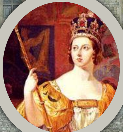
Виктория Alexandrina Victoria