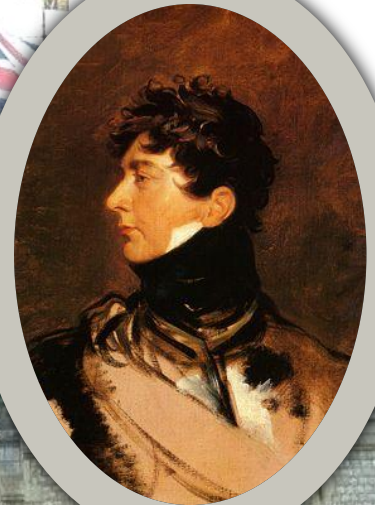
Георг IV George IV