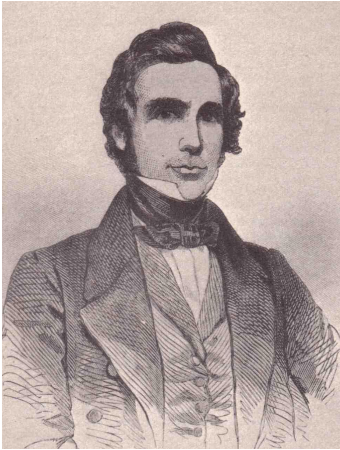
Уильям Ловетт (1800-1877)