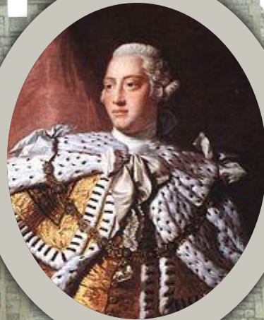
Георг III George William Frederick