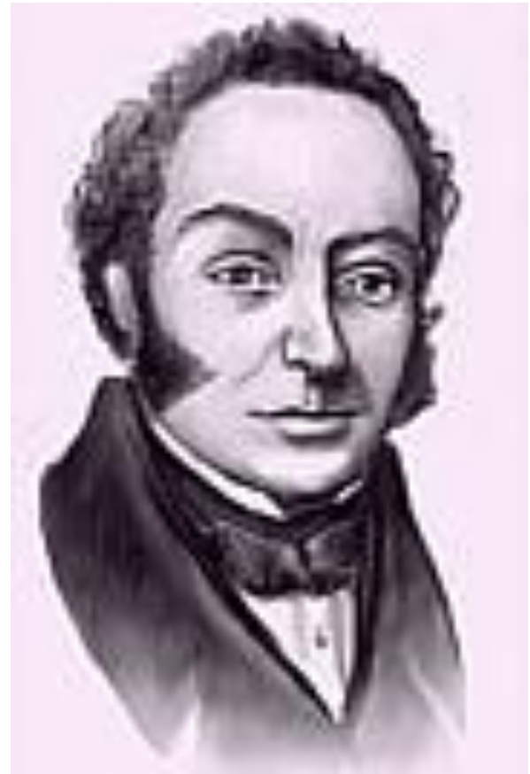
Фергюс О, Коннор (1796-1855)