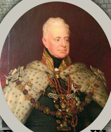
Вильгельм IV William Henry