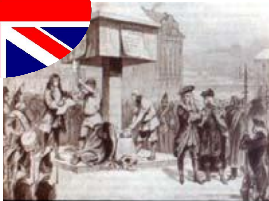
Казнь на эшафоте