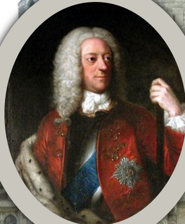
Георг II George II August