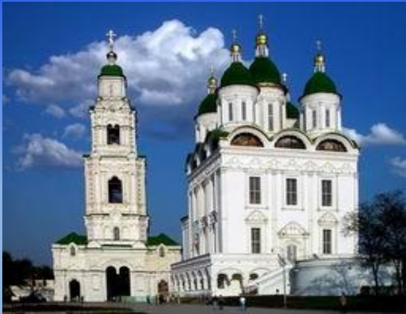
Успенский собор и соборная колокольня