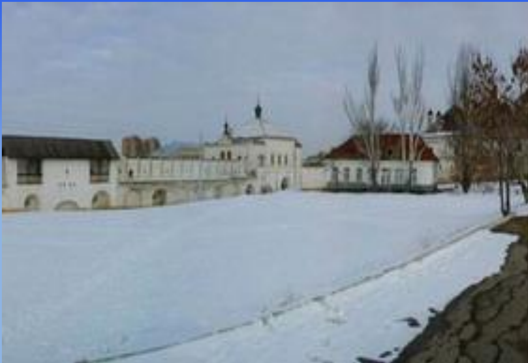
Водяные и Никольские ворота