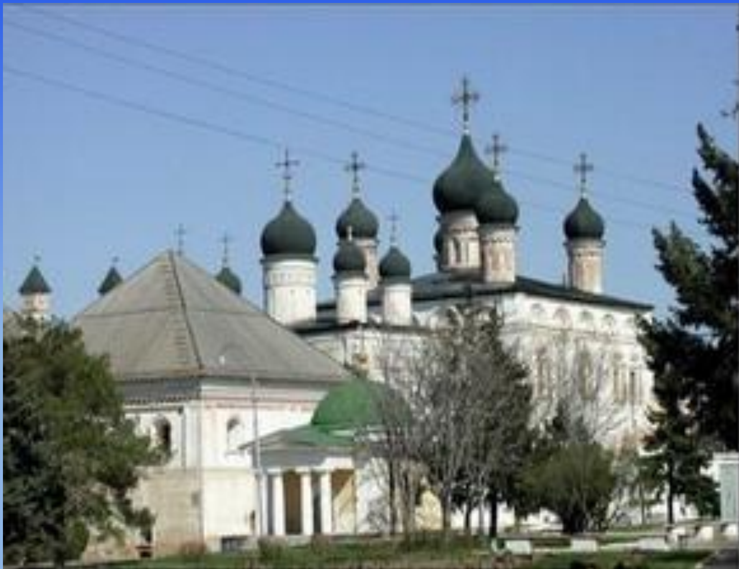
Троицкий собор и Кирилловская часовня