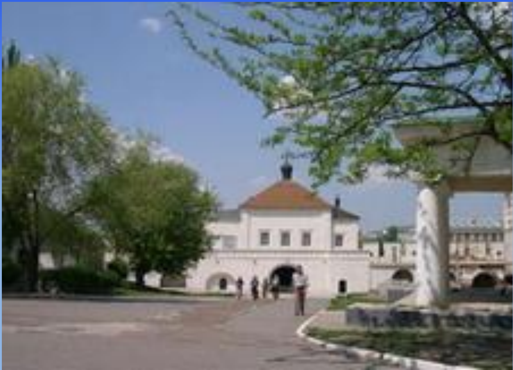
Никольские ворота и надвратный храм во имя Николая Чудотворца