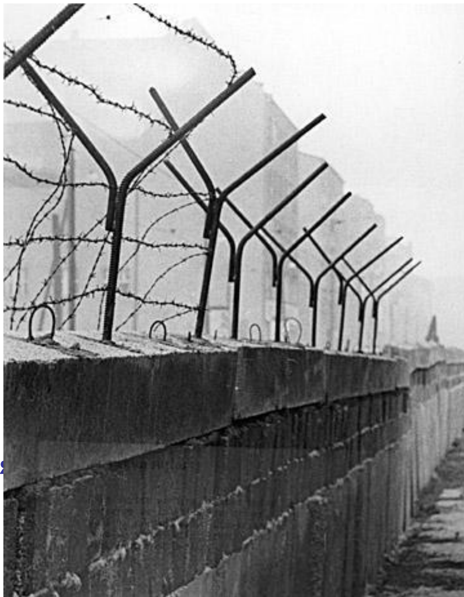
Возведение Берлинской стены