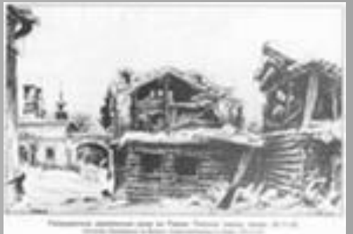
Улицы Ленинграда. Ленинградцы Виден в Ленинграде. Ленинградцы